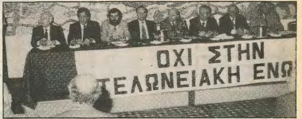
Απο τη σύσκεψη στο Φιλοξενία. Το σύνθημα «όχι στην τελωνειακή ένωση» δεν είναι αρκετό. Πρέπει να συνοδεύεται με πειστικό πρόγραμμα για έξοδο από την κρίση.

Τα καλέσματα των Αριστερών ηγεσιών για αξιοποίηση της μοντέρνας